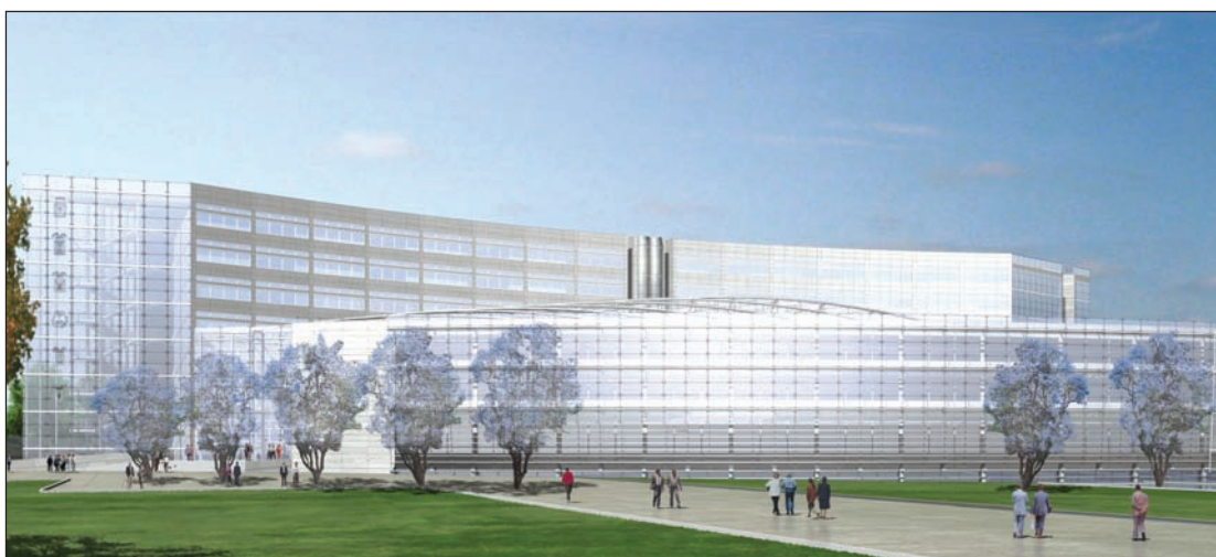
Progetto nuova sede Consiglio Regionale